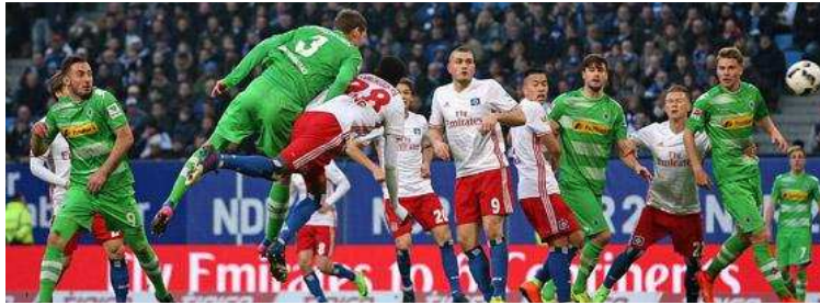
Andreas Christensen bringt die Gladbacher mit seinem Kopfball mit 1:0 in Führung

Nach dem Seitenwechsel ging es ähnlich intensiv zur Sache, vor allem die Hamburger hatten durch Wood (54./58.) und Ekdal (55.) erste Gelegenheiten. Der HSV hielt das Tempo hoch und ließ somit den Gästen kaum Gelegenheiten, zur Entfaltung zu kommen. Dennoch schlichen sich beim Gisdol-Team immer wieder leichte Abspielfehler ein, die es verhinderten, dass sich die zunehmende Überlegenheit des Bundesliga-Dinos auch in Zählbares ummünzte.